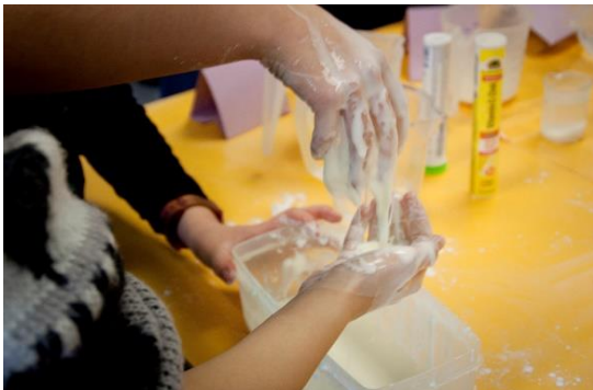
Suspensionen herstellen und Eigenschaften erleben

wurden. Die Stationen wurden so geplant und aufbereitet, dass die SchülerInnen der heterogenen Kleingruppen selbstständig experimentieren konnten. Dabei wurden unterschiedliche Zugangsmöglichkeiten der SchülerInnen – basal-perzeptiv, konkret-gegenständlich, anschaulich-symbolisch, begrifflich-abstrakt – berücksichtigt, sodass Erfahrungen im Bereich der grundlegenden Chemie vertieft, ausgebaut und erweitert werden konnten.