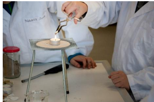
Brennbarkeit verschiedener Stoffe