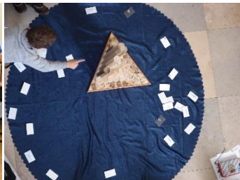
Links: Die Studierenden des Projektes Sinne.